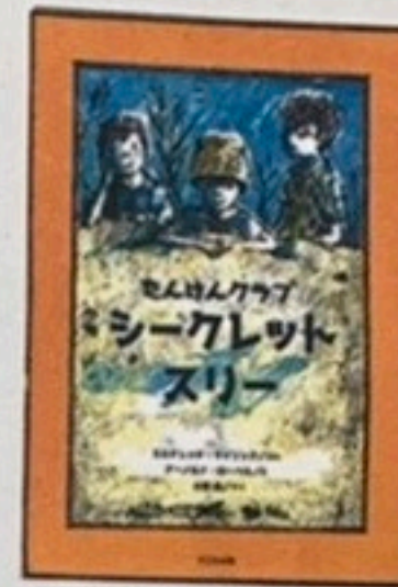
①ていがくねんむき