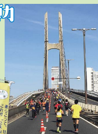
KIX泉州國際馬拉松 (2月)