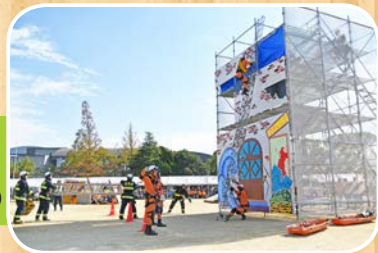
救出救護多数負傷者 対応訓練 (泉州南広域消防本部)