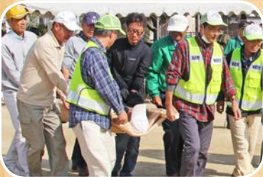
要救助者救出救助訓練 (田尻町自主防災組織)