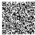
ふれ愛センター 公民館