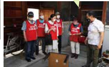
被災者宅でボランティア活動(模擬)

実際に災害が起こったときには、多くの力が必要です。力仕事だけではなく、被災者に寄り添い話を聞くなど、様々な力（スキル）が求められます。