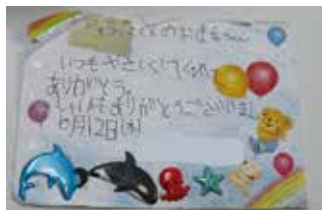
子どもからもらった手紙

約13年間活動してきて、見まもりに行けなかったのは1回だけで、他はずっと続けています。そんな甲斐あってか、何度か子どもたちや学校からお手紙や感謝状をもらったことがあり、とてもうれしく活動の励みになっています。