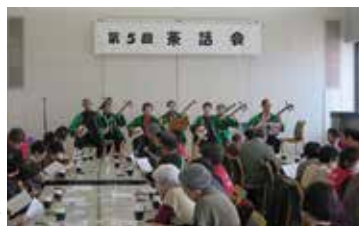
おひとり暮らしの高齢者対象の 茶話会のお手伝い