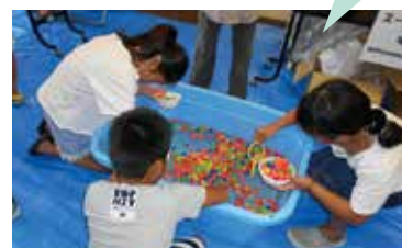
子ども向け縁日遊びの開催