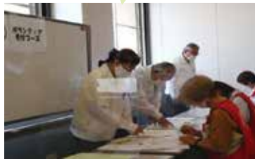
ボランティア受付の訓練