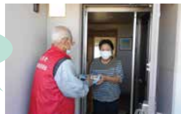
見守り声かけ訪問