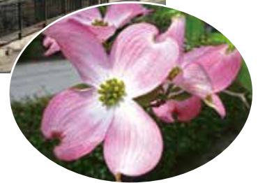
花のイメージ写真