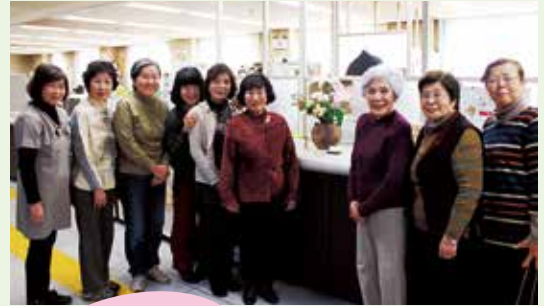
コスモス会の皆さん