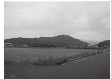
川棚荘比定地周辺の景観 (2017年9月撮影)

年、図3参照)。また、幕末の村や浦の状況を記す『豊浦藩村浦明細書』(山口県文書館、1965年)によれば、川棚高野村には法事堤・九門堤という堤がありました。