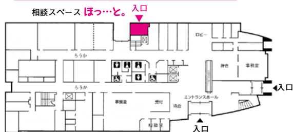
たじりふれ愛センター1階 案内図

不審者・不審車両を見かけたら、すぐに110番! 泉佐野警察署 電話 464-1234