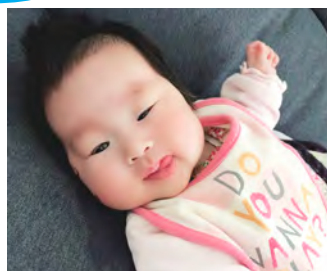
ゆめの 夢歩ちゃん (3か月)