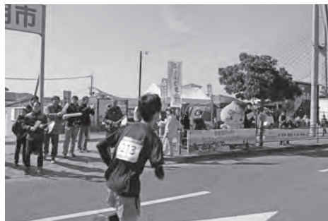
昨年の応援ブースの様子