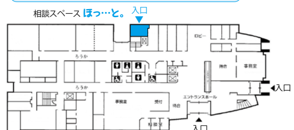
たじりふれ愛センター1階 案内図