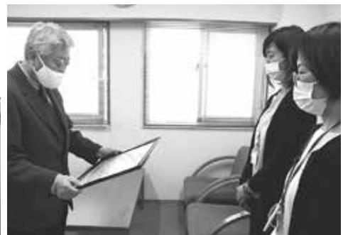
たじりエンゼルにて