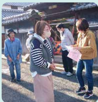
地区会 (コミュニティ活動)