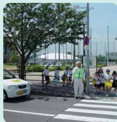
防犯連絡協議会 (防犯)