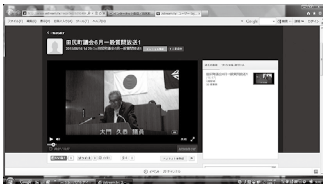
▲Ustreamの配信ページより

「田尻町ホームページ」→「町議会」→「インターネット配信」のページに行き、ページ下部の「〇〇議員の一般質問」のリンクから各議員の視聴ページへ行くことができます。（リンク先はUstream（ユーストリーム）という無料のサイトとなっております）