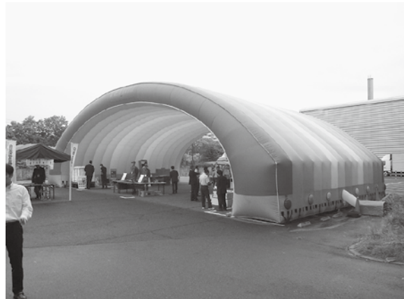
▲屋外展示ブースの見学