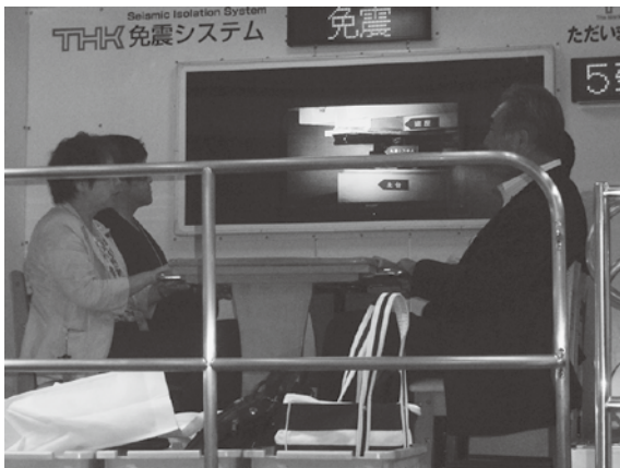
▲免震システム体験