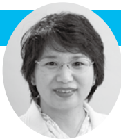
吉開 育子 議員