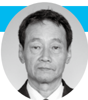
中川 達夫 議員