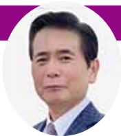
中野 静男 議員

※ 答 の中で、『安まち局課長』は安全安心まちづくり推進局課長兼局長、『文化・教育PT理事』は文化・教育施設建設プロジェクトチーム理事の略です。