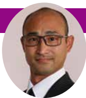
今井 猛史 議員