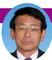
小川 雄司 議員